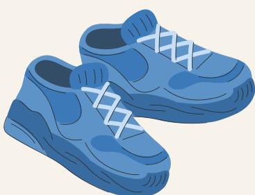
gebruikt gerecycled en stabiel bovenmateriaal en gerecyclede houten zolen of gemaakt van gerecycled rubberhars