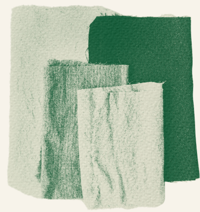
stoffen van gemakkelijk hernieuwbare gewassen (hennep, bamboe, brandnetel)