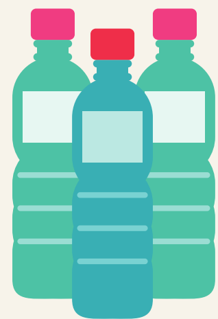
monturen voor zonnebrillen gemaakt van gerecycled post-consumentenafval