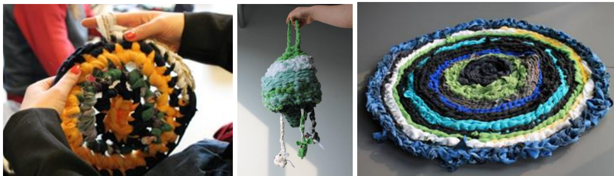
IMAGE 18. ΤΟ ΔΗΜΙΟΥΡΓΙΚΟ ΕΡΓΑΣΤΗΡΙΟ RTU

Source: from the archive of Riga Technical University (RTU Institute of Design Technologies, 2015) https://www.facebook.com/media/set/?set=a.671881669590181&type=3