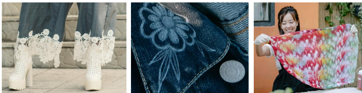
IMAGE 8. ΠΑΡΑΔΕΙΓΜΑΤΑ ΕΞΩΡΑΪΣΜΟΥ ΡΟΥΧΩΝ

Τα ρούχα μπορούν να αποκτήσουν νέα όψη προσθέτοντας διάφορες διακοσμητικές λεπτομέρειες, χρησιμοποιώντας κεντήματα, ζωγραφική ή βαφή στο χέρι (βλ. Εικόνα 8).