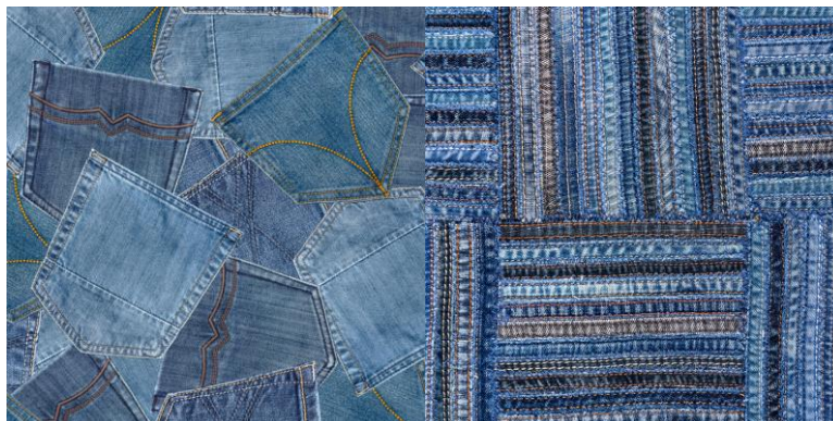
IMAGE 16. INTERIOR TEXTILES FROM PARTS OF JEANS