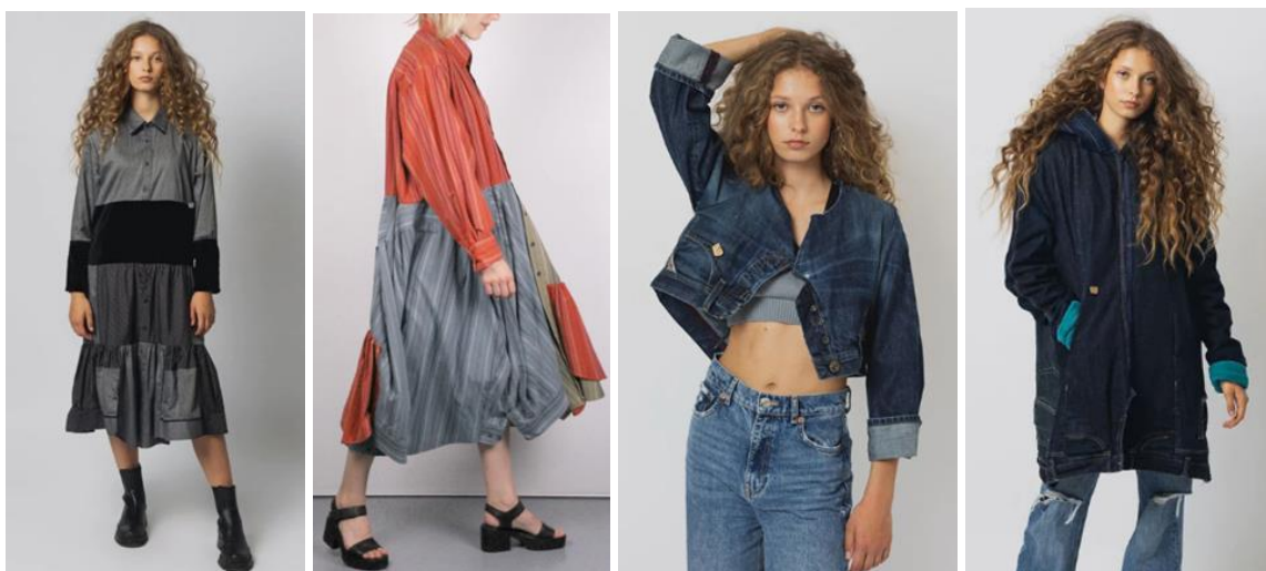
IMAGE 5. ΠΟΥΚΑΜΙΣΕΣ ΑΠΟ ΑΝΔΡΙΚΑ ΠΟΥΚΑΜΙΣΑ ΚΑΙ ΣΑΚΑΚΙΑ ΑΠΟ ΤΖΙΝ. DESIGNER AIVA ZĪLE

Ο Λετονός σχεδιαστής μόδας Αίβα Ζίλε (ZĪLE, 2023) αγωνίζεται για ένα πιο βιώσιμο μέλλον μέσω της έννοιας της ανακύκλωσης (βλ. Εικόνα 5). Τα κύρια υλικά της ετικέτας είναι τζιν παντελόνια και πουκάμισα. Η ZĪLE δεν φτιάχνει μόνο ανακυκλωμένα ρούχα από ανδρικά πουκάμισα, αλλά προσφέρει επίσης μοναδικές πουκαμίσες από τα πουκάμισα που στέλνουν οι ίδιοι οι πελάτες.