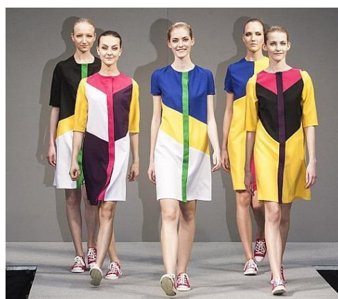
IMAGE 9. ΕΝΔΥΜΑΤΑ ΑΠΟ ΥΠΟΛΕΙΜΜΑΤΑ ΥΦΑΣΜΑΤΩΝ ΚΑΙ ΣΚΡΑΠ.