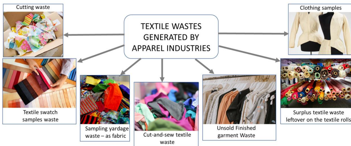
IMAGE 2. ΑΠΟΡΡΙΜΜΑΤΑ ΥΦΑΝΤΟΥΡΓΙΑΣ ΠΟΥ ΠΑΡΑΓΟΝΤΑΙ ΑΠΟ ΒΙΟΜΗΧΑΝΙΕΣ ΕΝΔΥΜΑΤΟΣ

Οι διάφοροι τύποι απορριμμάτων που παράγονται στη βιομηχανία ένδυσης (βλ. Εικόνα 2) από τη διαδικασία λήψης δειγμάτων έως το κατάστημα λιανικής είναι δειγματοληψία απορριμμάτων ως ύφασμα ή ένδυμα, υπολείμματα υφασμάτων ρολών, απορρίμματα κοπής και ραπτικής ή απούλητα έτοιμα απορρίμματα ενδυμάτων.