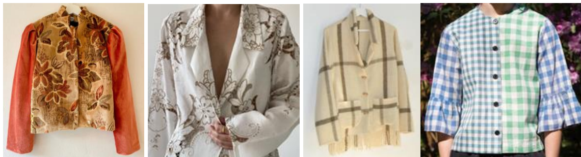
IMAGE 13. ΜΕΤΑΤΡΟΠΗ ΥΦΑΝΤΟΥΡΓΙΚΩΝ ΣΠΙΤΙΟΥ ΣΕ ΡΟΥΧΑ. HÔTEL VETEMENTS