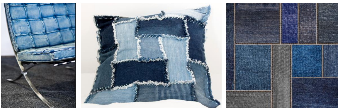
IMAGE 15. ΥΦΑΣΜΑΤΑ ΕΣΩΤΕΡΙΚΟΥ ΧΩΡΟΥ ΑΠΟ ΜΕΤΑΧΕΙΡΙΣΜΕΝΑ ΕΝΔΥΜΑΤΑ

Όταν φτιάχνετε εσωτερικά υφάσματα και άλλα αντικείμενα από ρούχα, είναι δυνατό να χρησιμοποιήσετε όχι μόνο ολόκληρο το ρούχο σε ένα κομμάτι, αλλά κάθε λεπτομέρεια του. Αυτό συμφωνεί με τη γενική ιδέα ότι τίποτα δεν πρέπει να πετιέται. Για παράδειγμα, τα καθίσματα τζιν μπορούν να κατασκευαστούν από ολόκληρα τζιν ( https://www.pinterest.com/pin/51228514501236638 ). Χρησιμοποιώντας κομμάτια υφάσματος και ράβοντάς τα μεταξύ τους με την τεχνική του μπαλώματος, είναι δυνατό να δημιουργηθούν εσωτερικά υφάσματα μοναδικού σχεδιασμού (βλ. Εικόνα 15).