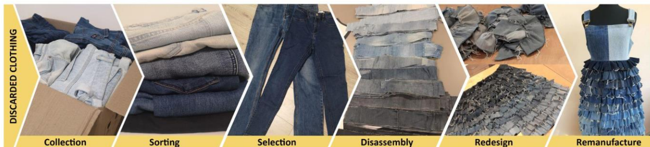
IMAGE 11. ΑΝΑΚΑΤΑΣΚΕΥΗ ΤΖΙΝ ΣΕ ΦΟΡΕΜΑ

Τα ρούχα που πρόκειται να ανανεωθούν πρέπει να είναι καθαρά, πλυμένα και να αξιολογούνται για προηγούμενες φθορές πριν από τη χρήση. Εάν ένα άλλο προϊόν είναι κατασκευασμένο από πολλά προϊόντα, τότε θα πρέπει να ληφθεί υπόψη η συμβατότητα των υλικών ένδυσης - ποιος θα είναι ο