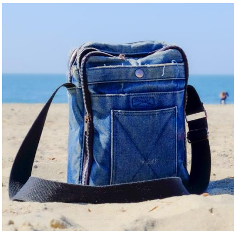
IMAGE 14. ΤΣΑΝΤΑ ΑΠΟ ΜΕΤΑΧΕΙΡΙΣΜΕΝΟ ΥΦΑΣΜΑ ΤΖΙΝ