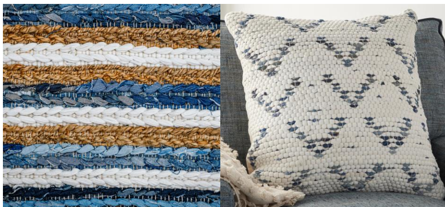
IMAGE 17. ΠΑΡΑΔΕΙΓΜΑΤΑ ΥΦΑΣΜΑΤΩΝ ΕΣΩΤΕΡΙΚΟΥ ΧΩΡΟΥ ΑΠΟ ΥΦΑΣΜΑΤΙΚΕΣ ΛΩΡΙΔΕΣ