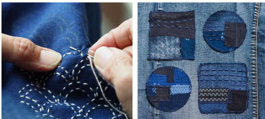
IMAGE 7. ΤΕΧΝΙΚΕΣ ΕΠΙΔΙΟΡΘΩΣΗΣ SASHIKO ΚΑΙ BORO