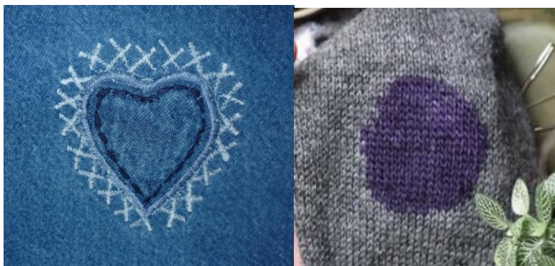
IMAGE 6. ΠΑΡΑΔΕΙΓΜΑΤΑ ΟΡΑΤΩΝ ΕΠΙΜΟΡΦΩΣΕΩΝ

πάνω από την περιοχή που πρέπει να επισκευαστεί για μικρότερες τρύπες και σκισίματα και μπορείτε να παίξετε με την προσθήκη υφασμάτων μπαλωμάτων και να κεντήσετε τις άκρες ή τα μοτίβα κατά μήκος των μπαλωμάτων για μεγαλύτερες επιφάνειες. Σε τρύπες ή μπαλώματα από μαλλί που αρχίζουν να φθείρονται, τεχνικές όπως το ελβετικό darning (καρίκωμα) μπορούν να εκτελεστούν χρησιμοποιώντας νήματα αντίθετων χρωμάτων.