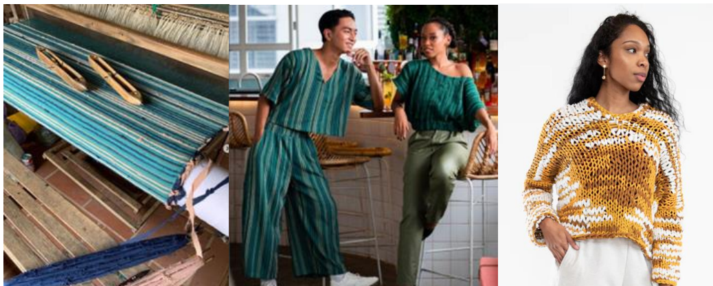
IMAGE 10. ΧΕΙΡΟΠΛΕΚΤΟ ΥΦΑΣΜΑ ΚΑΙ ΠΛΕΚΤΑ ΕΝΔΥΜΑΤΑ ΑΠΟ ΣΚΡΑΠ ΥΦΑΣΜΑΤΑ. TONLE

υπολείμματα παραγωγής από την προηγούμενη σεζόν. Στη συνέχεια τυλίγονται σε μεγάλα μήκη υφασμάτων «νημάτων», τα οποία υφαίνονται σε ενδύματα που έχουν ανακυκλωθεί δύο φορές.