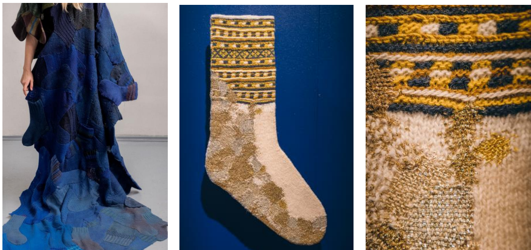
IMAGE 19 ΠΑΡΑΔΕΙΓΜΑΤΑ ΑΠΟ ΤΗΝ ΕΚΘΕΣΗ

Source: https://www.lma.lv/en/actual-3/if-you-want-to-mend-the-world-start-mending-your-socks-salonesatallite-2022.