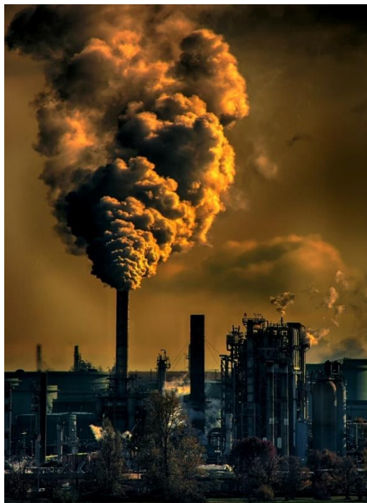
FIGURA 5. STUDII ȘTIINȚIFICE AU ARĂTAT CĂ PĂMÂNTUL A SUFERIT DEJA DISTRUGERI IREPARABILE.

Această conștientizare privind mediul în care trăim a devenit deosebit de importantă în ultimii ani, când comunitatea științifică a observat că acțiunile omului afectează direct și negativ mediul (Figura 5).