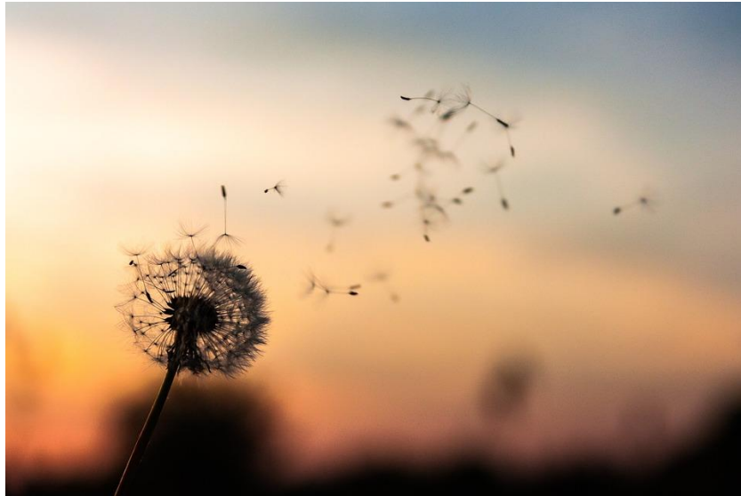
FIGURA 6. CONȘTIENȚIZAREA ESTE CHEIA PENTRU MATERIALIZAREA SPERANȚELOR PRIVIND VIITORUL PLANETEI