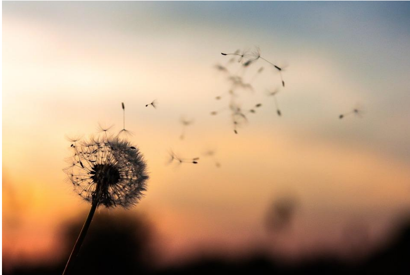
IMAGE 6. Η ΕΝΗΜΕΡΩΣΗ ΕΙΝΑΙ ΚΛΕΙΔΙ ΓΙΑ ΝΑ ΥΠΑΡΞΕΙ ΕΛΠΙΔΑ