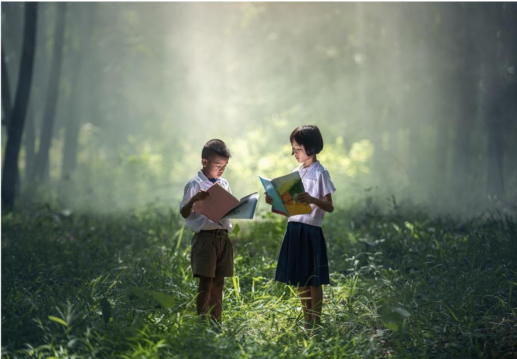
IMAGE 7. Η ΕΚΠΑΙΔΕΥΣΗ ΕΙΝΑΙ ΚΛΕΙΔΙ ΓΙΑ ΤΗΝ ΠΡΟΣΤΑΣΙΑ ΤΟΥ ΠΕΡΙΒΑΛΛΟΝΤΟΣ

Ωστόσο, αυτό το μοντέλο δεν εγγυάται την ανισότητα των φύλων, τα σεξιστικά στερεότυπα που μεταδίδονται, ούτε κάνει ορατή τη συμβολή των γυναικών στην κοινωνία και στα διάφορα γνωστικά πεδία. Η μελέτη του προγράμματος σπουδών ασχολείται με τον εντοπισμό αυτών των σεξιστικών προκαταλήψεων και, μέσω της συνεκπαίδευσης, τη δημιουργία συνειδητοποίησης και τον μετασχηματισμό του τρόπου με τον οποίο γίνεται κατανοητή η διαδικασία διδασκαλίας-μάθησης.