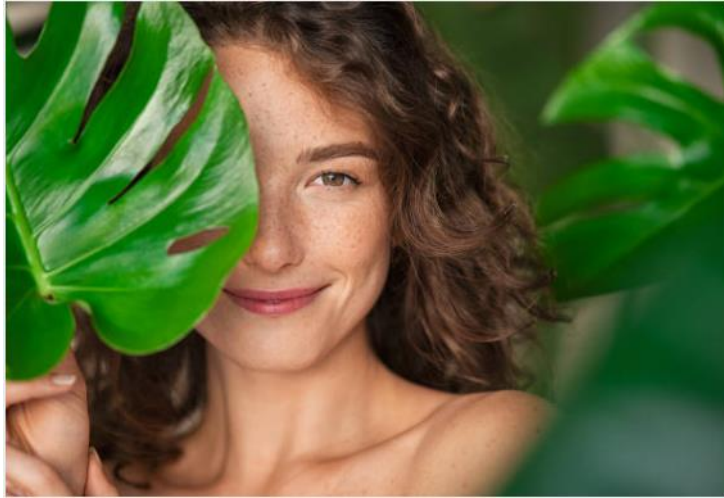
IMAGE 3. Ο ΟΙΚΟΦΕΜΙΝΙΣΜΟΣ ΕΙΝΑΙ ΤΟ ΑΠΟΤΕΛΕΣΜΑ ΤΗΣ ΕΝΩΣΗΣ ΜΕΤΑΞΥ ΔΥΟ ΤΕΛΕΥΤΑΙΩΝ ΙΔΕΟΛΟΓΙΩΝ