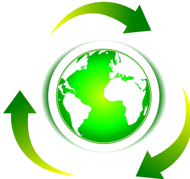
IMAGEN 1. EL RECICLAJE GENERA UN CÍRCULO VIRTUOSO DE CRECIMIENTO SOSTENIBLE

En conclusión, la diferencia entre reciclaje y upcycling es que el reciclaje tiene que pasar por un proceso industrial para descomponerlo y reutilizarlo en el proceso de fabricación y el upcycling utiliza un producto usado o partes de él para fabricar otro de mayor valor sin haber pasado por ningún proceso industrial de descomposición y mezcla con otros materiales.