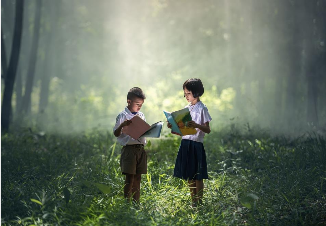
IMAGE 7. LA EDUCACIÓN ES CLAVE PARA SALVAGUARDAR EL MEDIO AMBIENTE

de localizar estos sesgos sexistas y, a través de la coeducación, generar una toma de conciencia y una transformación de la forma de entender el proceso de enseñanza-aprendizaje.