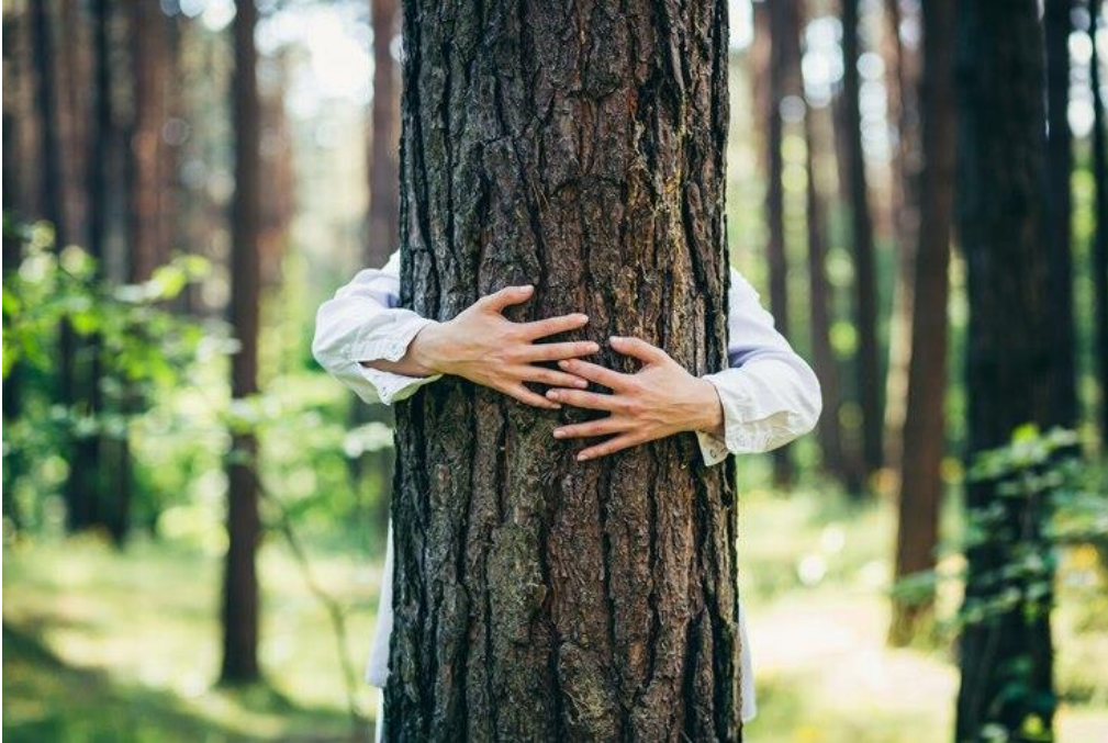
IMAGE 4. EL MOVIMIENTO FEMENINO DE CHIPKO ES UN EJEMPLO DE LA LUCHA PACÍFICA DE LAS MUJERES PARA SALVAGUARDAR LA NATURALEZA.

Estimular métodos de formación innovadores basados en el género para promover el RECICLAJE DE ROPA a través de La Realidad